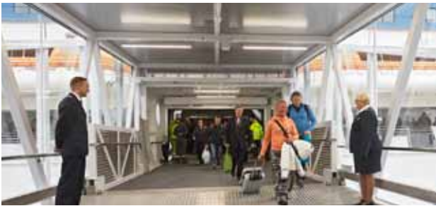
Från Siljaterminalen används just nu en provisorisk anslutning till den nya passagerargången. Under byggtiden blir det längre att gå till fartygen men när den nya terminalen är klar blir det närmare till fartygen än det var innan ombyggnaden. T.h. och nedan: Visionsbild över hur terminalbyggnaden kommer se ut när den är färdig.