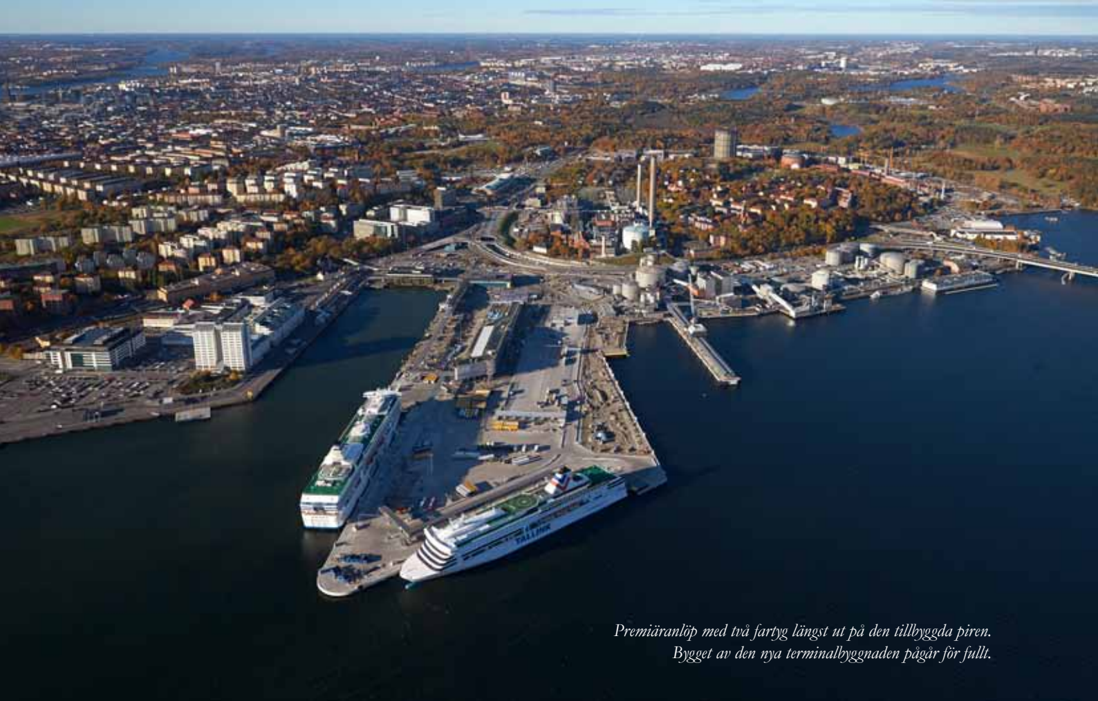
Premiäranlöp med två fartyg längst ut på den tillbyggda piren. Bygget av den nya terminalbyggnaden pågår för fullt.